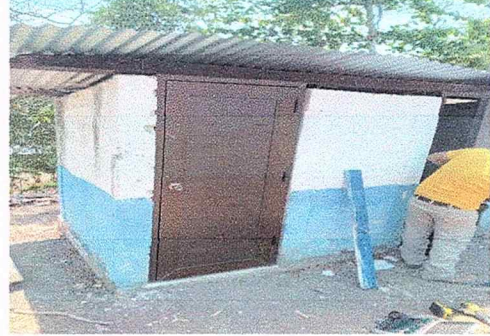
Foto 2: Señala el 60% del trabajo ya realizado en el remozamiento de los baños de la escuela.