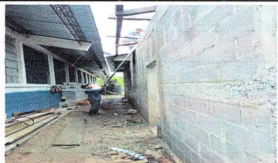
Foto 6. Para el efecto de la construcción se muestra en la colocación de las costaneras del proyecto de bodega.

Observación: Si es necesario se pueden agregar hojas adicionales y actualizar el número de hojas.