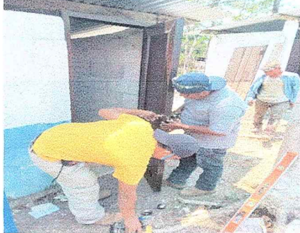
Foto 1: Esta fotografía demuestra el avance del trabajo realizado en cuanto los baños del Centro Educativo.