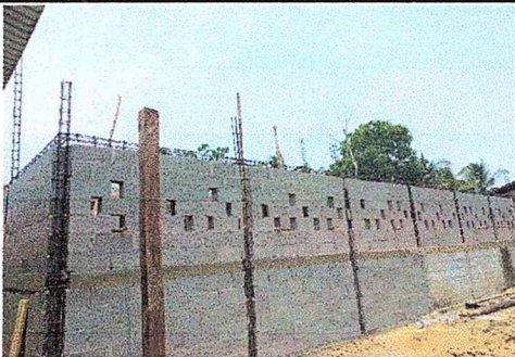
Foto 5: De acuerdo a la altura de la construcción se culmina la circulación con materiales de block.