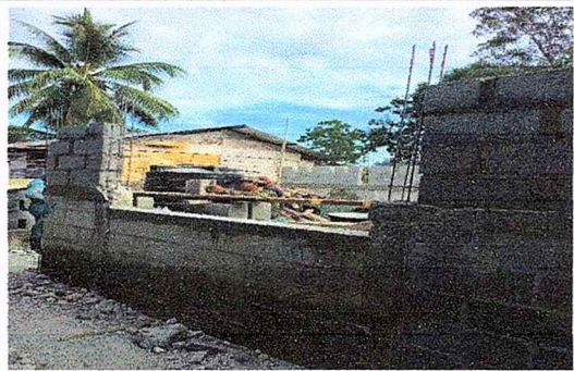
Foto 4: Durante el proceso se encuentra con el avance del techado de block, con la colocación de barillas de construcción.